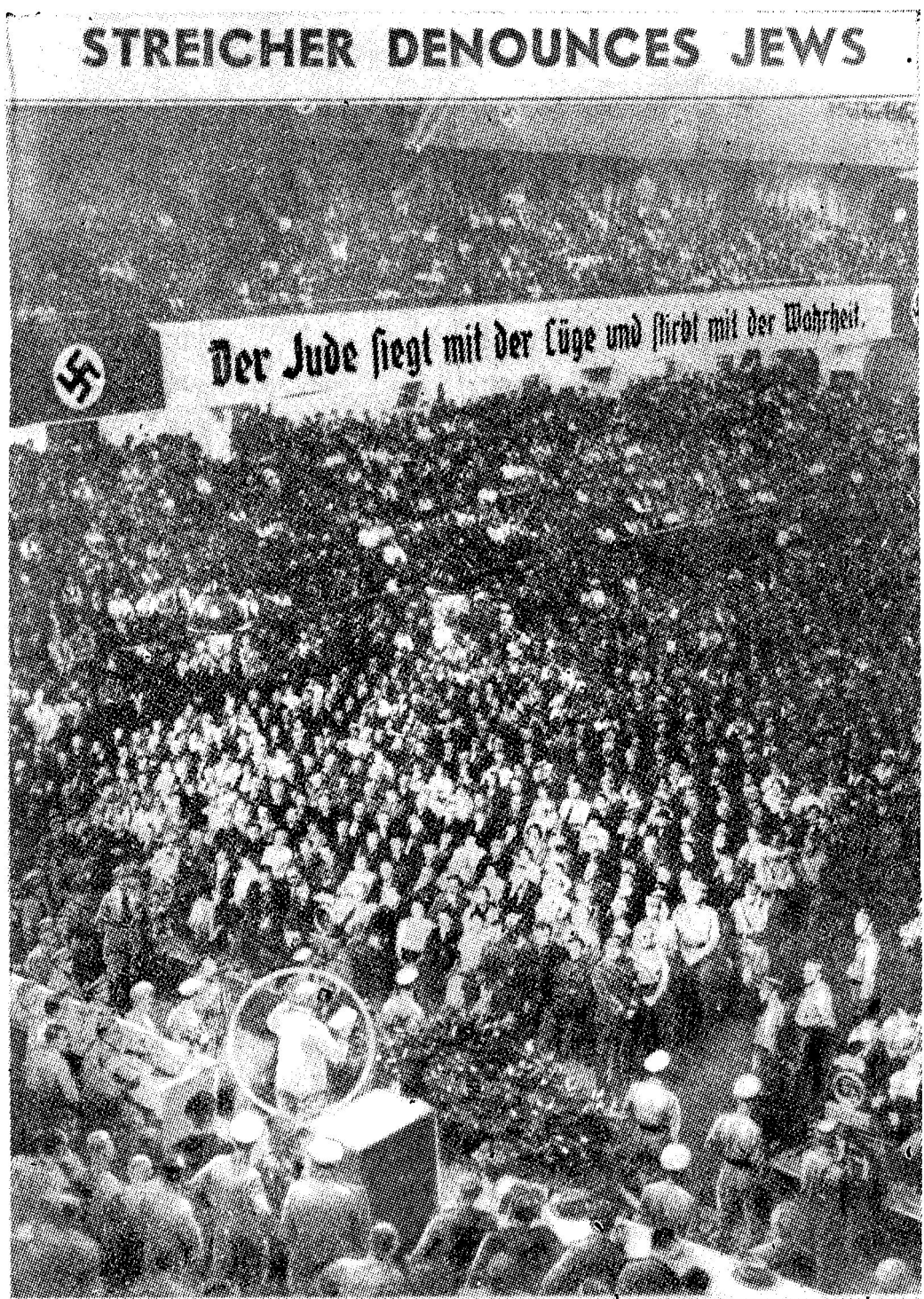
FACING HUGE banner that reads "The Jew conquers with lies and dies with truth." Julius Streicher, Hitler's No. 1 Jew baiter, addresses tremendous audience in the Berlin Sportpalast, opening new campaign against the Jews of the Reich.