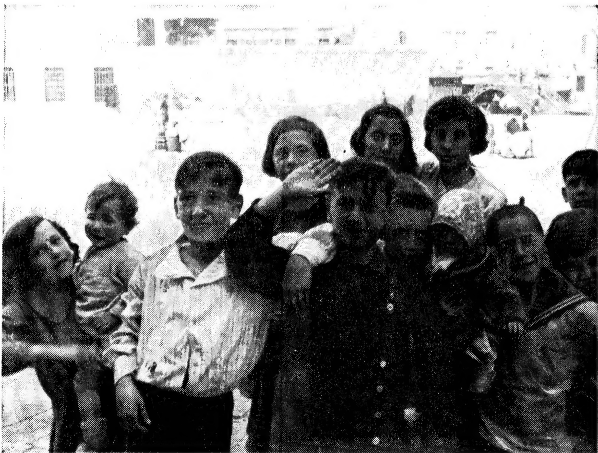
Man sieht ihnen die „chutzpe“ (Fremdheit) am Gesicht an!