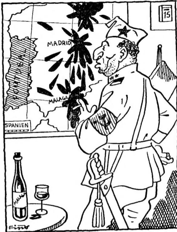
Erkenntnis Es ist schon recht, die Weltgeschichte werd mit Blut geschrieben, aber wenn mer nicht kann schreiben, macht mer bloß Kleckse.