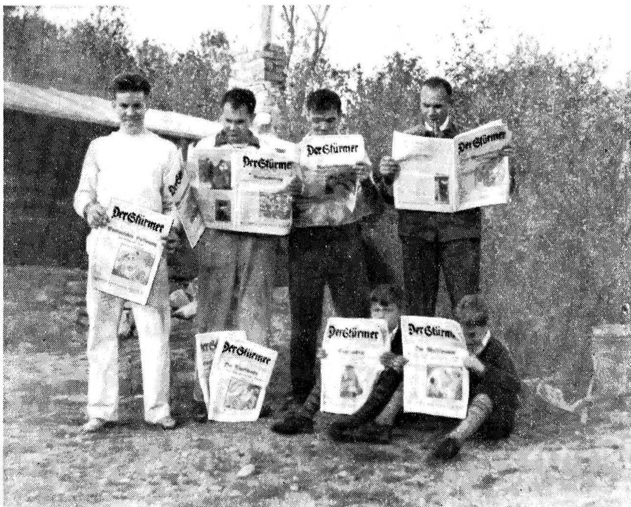
Stürmerleser in U. S. A. (Nordamerika)

Wenn man wissen will, ob etwas gut oder schlecht ist, braucht man bloß darauf zu hören, was der Jude dazu sagt. Daß die Juden der ganzen Welt gegen jenes Bilderbuch vom Leder ziehen, beweist seinen großen Wert.