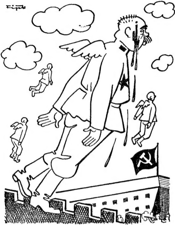
Beförderungen in Sowjetrußland Väterchen Stalin ist dabei, einen nach dem andern seiner Mitarbeiter für geleistete Dienste zu befördern — allerdings ins Jenseits