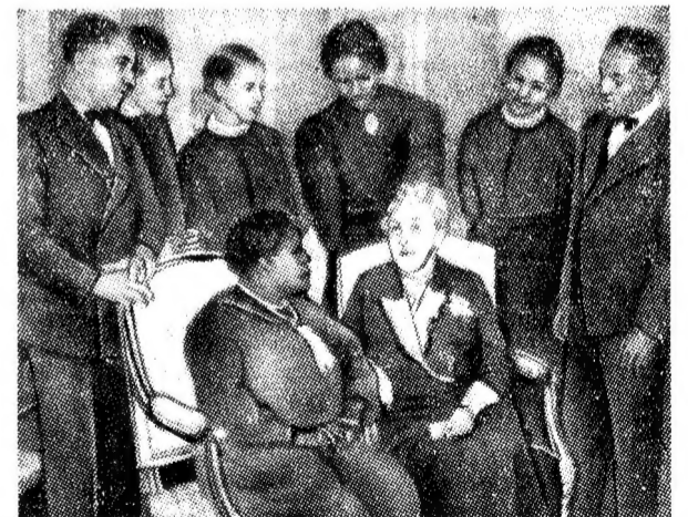
(Aus der „Daily News“ (Newyork) vom 17. Dez. 1936)

Eine Delegation der Bethune-Cookman-Universität in Daytona, Florida, besucht die Mutter des Präsidenten in ihrem Heim in der East 65. Straße. Neben ihr (links) sitzt Frau Mary Bethune, die Vorsitzende der Universität. (Hieraus ersieht man, wie wenig Gewicht man in den intellektuellen Kreisen Amerikas auf die Rassenfrage legt. Ebenso wie mit den Negeren verhält es sich mit den Juden. Der Uebersetzer.)