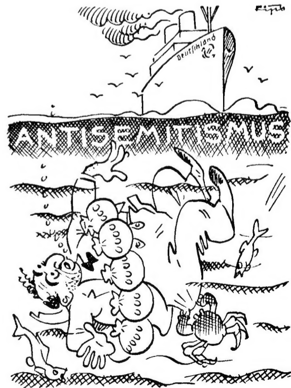
E.D.E. Israel Geldsäcke sind nicht immer das Richtige, um als Rettungsgürtel über Wasser zu halten.