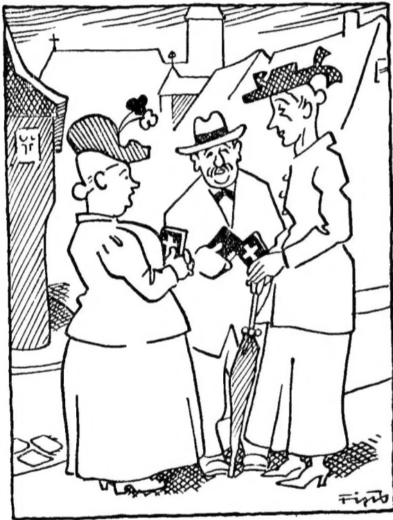
Im schwarzen Erdteil Mein Gott, unser Herr Pfarrer trägt halt schwer an sein'm Kreuz, indem, daß heut auch solchene, die ihre Gaten haben, gibt.