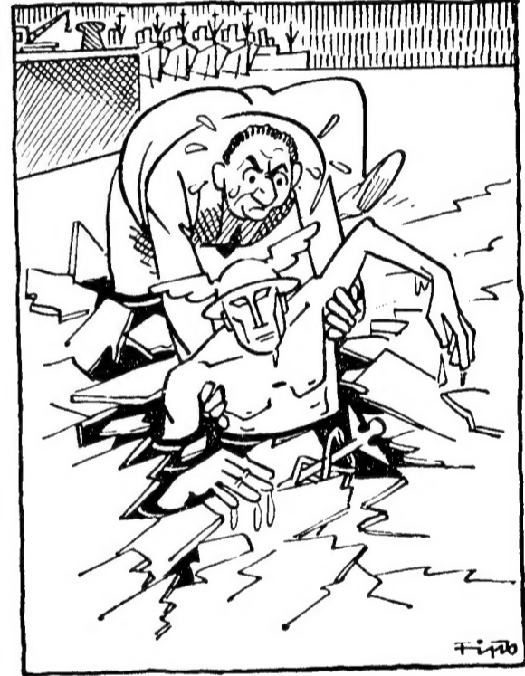
Der eingefrorene Merkur Mit unserm Boykott gegen Daitchland is uns der ganze Handel eingefroren und bei jedem Rettungsversuch holt mer sich nur kalte Füß'.