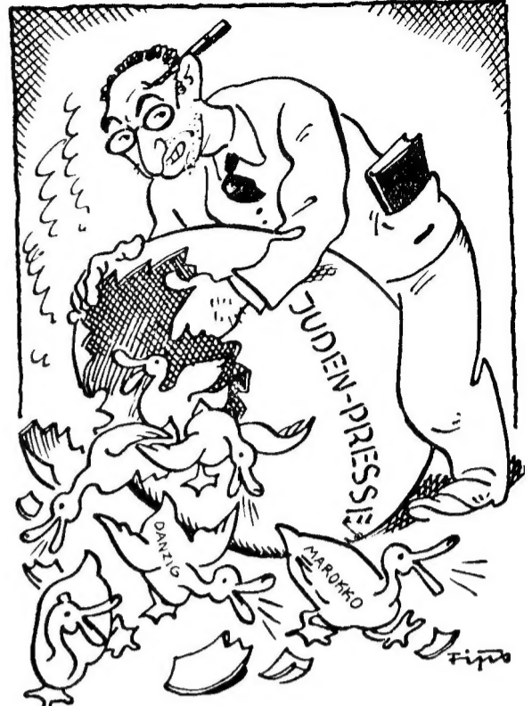
Zeitungsenten Rebbich, um unier Brutgeschäft muß uns jeder Züchter beneiden, nur schade, daß es jeder bald an den Kragen geht.