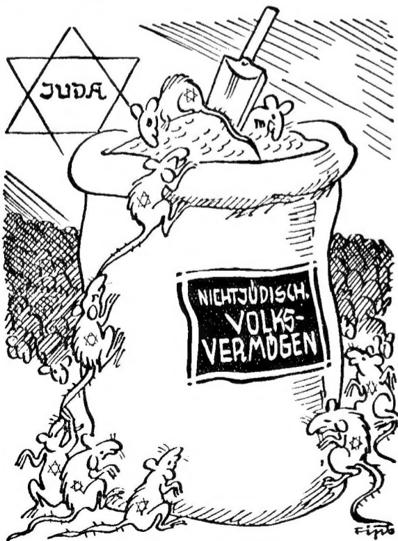
Wanderrattenplage Umsonst sind überall Mäh und Fleisch, Wo man die Ratten nicht zu bannen weiß.