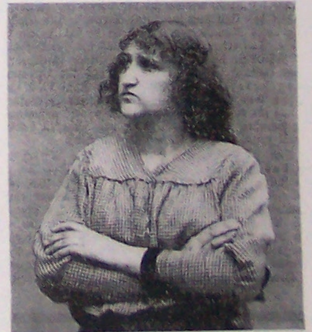
Ärmliche Tochter des Satans