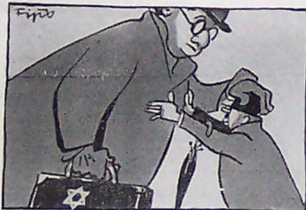
Judenknecht Ein kleiner Geist, der Juda stützt, Bringt Schaden, ohne daß er nützt.