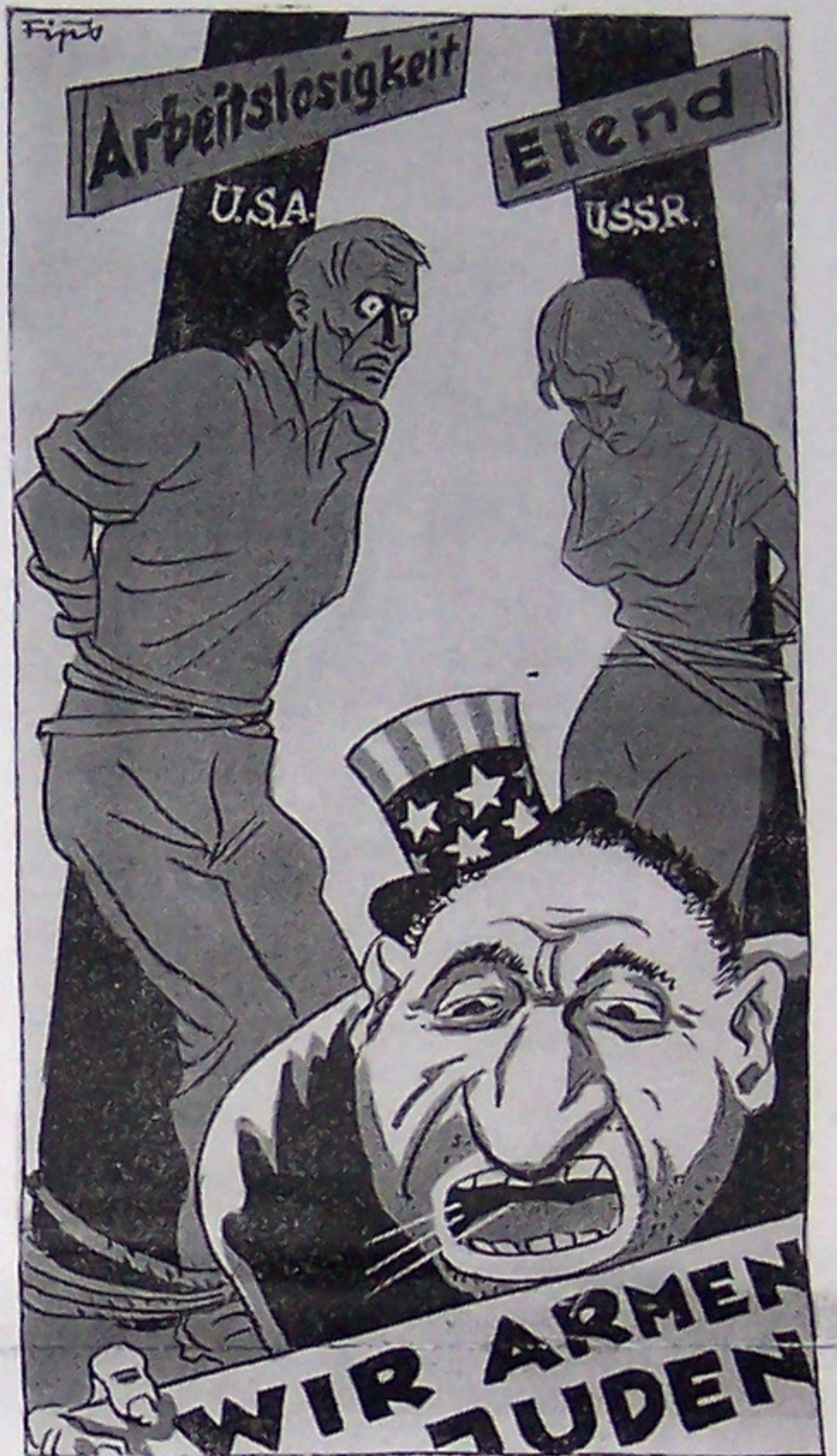
Jammer Ist sich der Jude selbst so leid? Weil er so laut um Mitleid schreit? O, nein! Verflauter Völler schmerzlich Stöhnen Sucht er damit zu überdrienen.