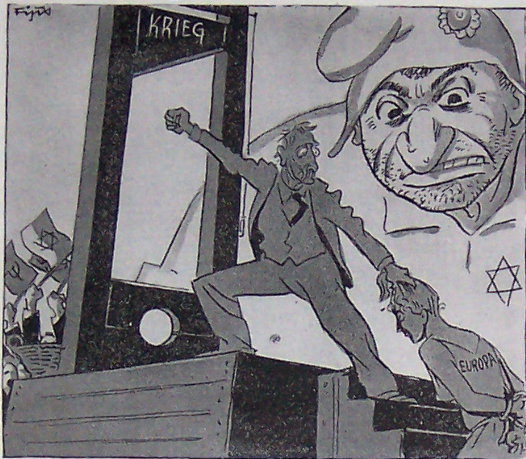
Totentanz Dem Juden darf es nie gelingen Europa auf Scharoff zu bringen. Befreit es aus des Juden Händen, soll's nicht mit Schimpf und Schande enden.