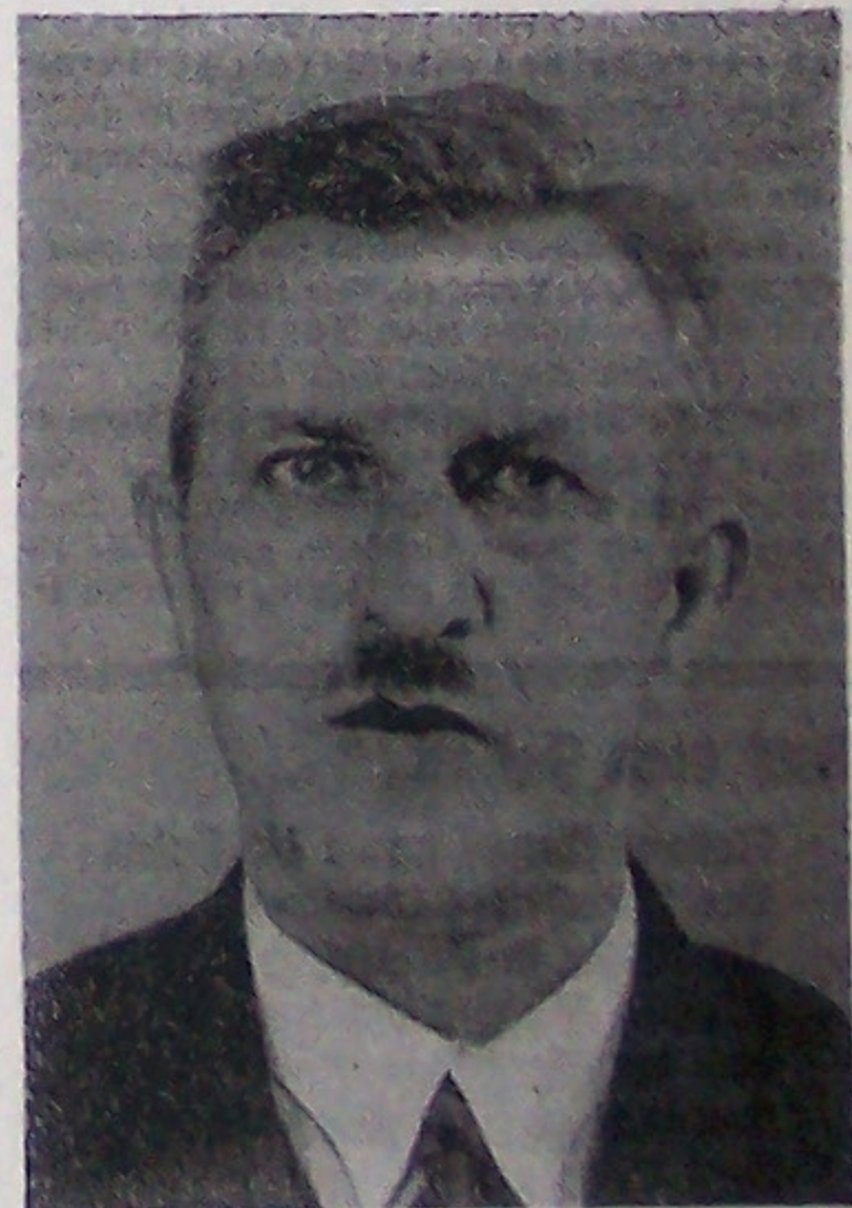
Amstliche Bilder Dänischer-Rache