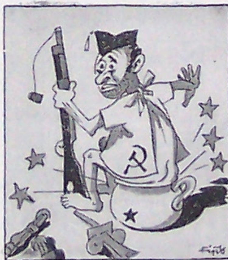
Unruhen in Spanien Kein Wunder, wenn es im Hasen der Roten, Bei inn'rer Verstimmung, kracht nach Roten.