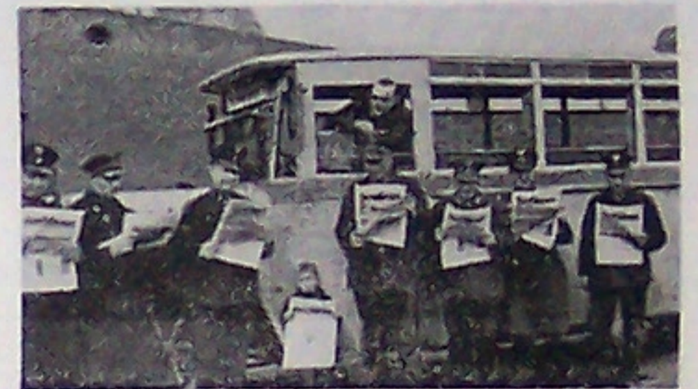
Die Beamten der Berliner Verkehrsgesellschaft sind eifrige Stürmerleser