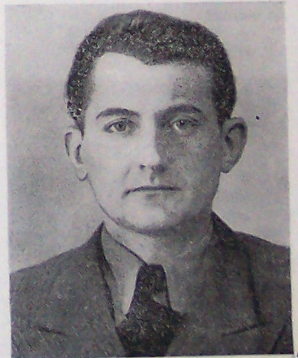
Ähnliche Bilder Stürmer-Köpfe