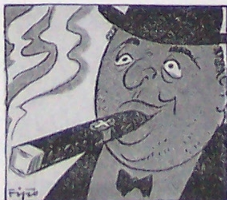
Schweizer Presse — Schweizer Stumpen überall künstlich Damit macht „man“ viel blauen Dunst —