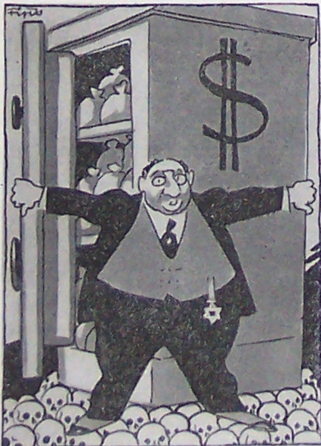
Gottheit Geld Der Geldschrank — Judas heil'ger Schrein, Gequälter Menschheit — Opferstein.