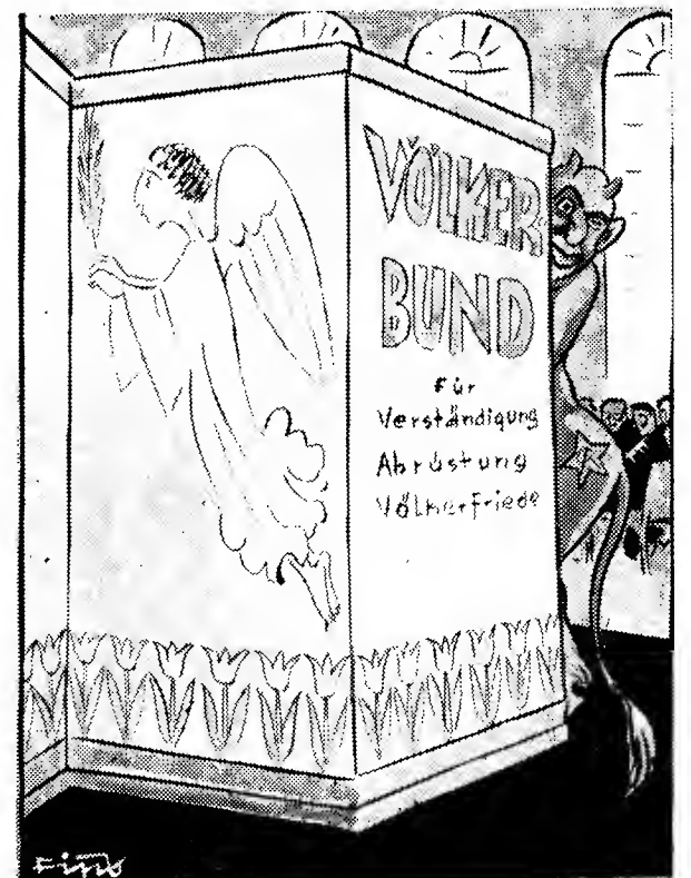
Sinker einer spanischen Wand Lut sich öfters allerhand

Ohne Lösung der Judenfrage keine Erlösung des deutschen Volkes