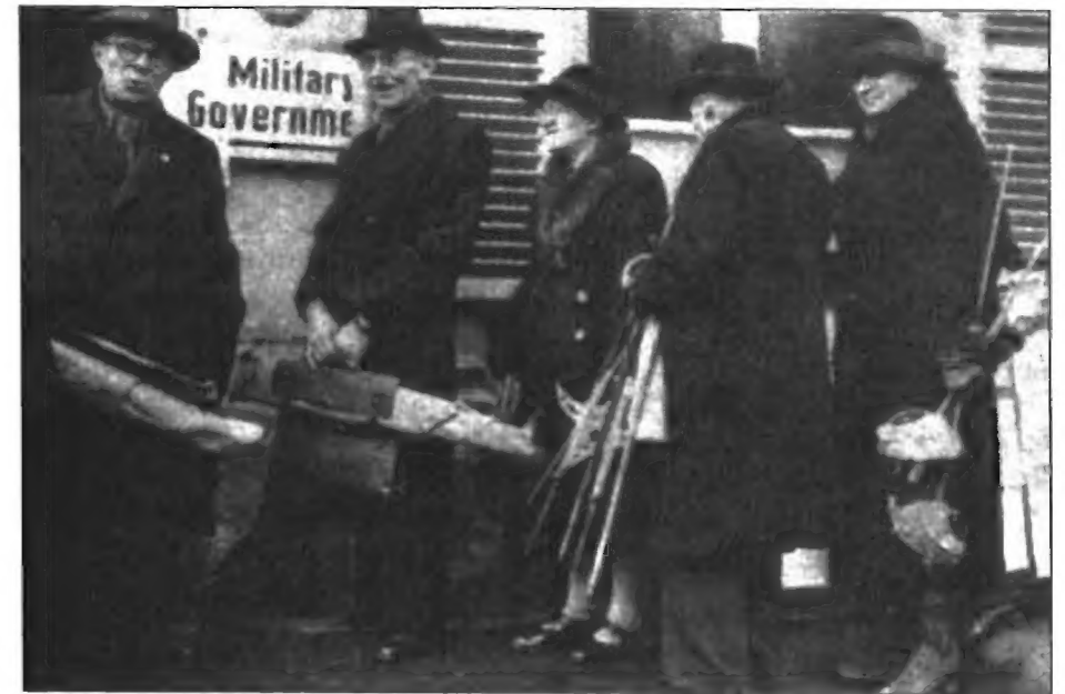
GERMAN CIVILIANS were ordered by American occupiers to turn in all of their weapons (including fencing swords, as held by the man at the right) in 1945. They lined up at collection points all over Germany to do so. GIs were amazed that German civilians owned so many firearms.

Five years later, in 1933, the National Socialists were in power, Hitler